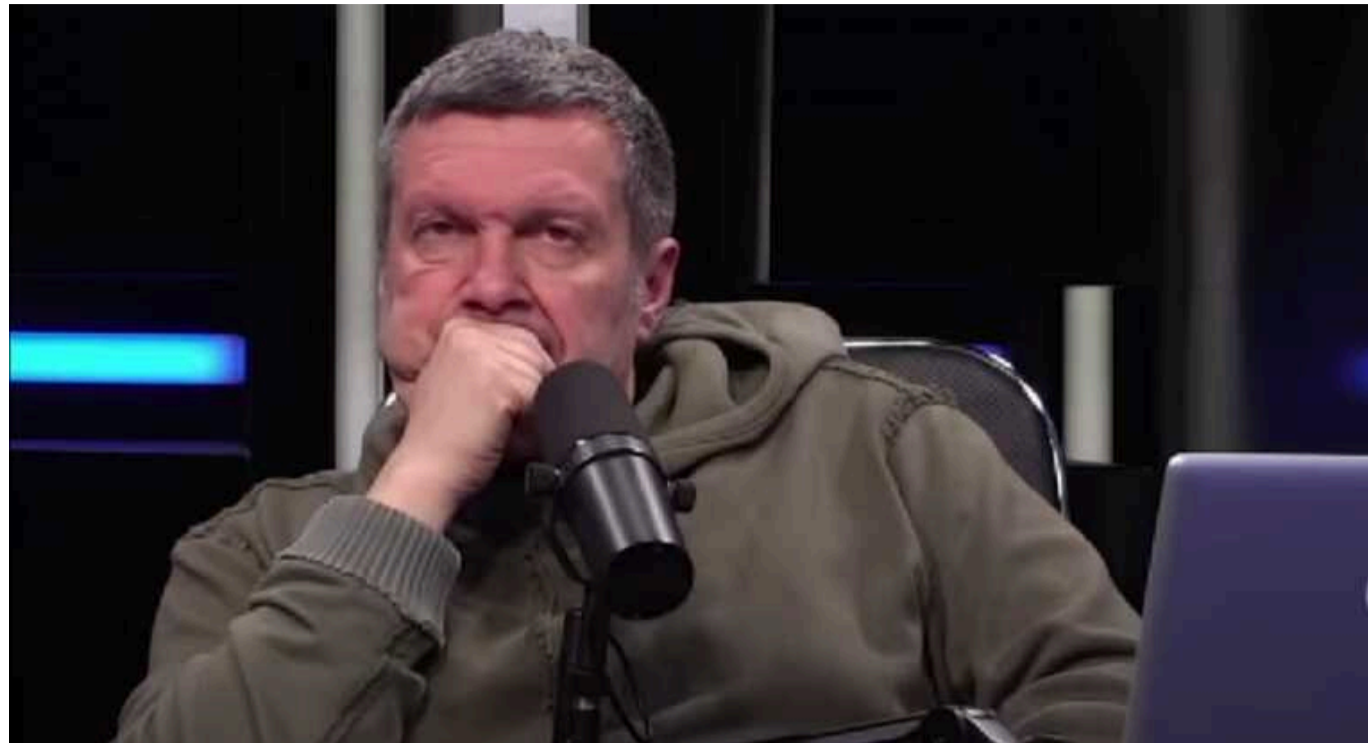
Пропагандист Соловйов в ефірі росТБ розмірився про війська РФ в Берліні, Парижі та Італії

Російський пропагандист Володимир Соловйов в ефірі державного телеканалу закликав до окупації Європи "до Атлантики". На його думку, російські війська мають бути не лише у Києві, а й у Берліні, Парижі, Лісабоні та інших європейських столицях, також згадав про свою втрачену нерухомість в Італії.