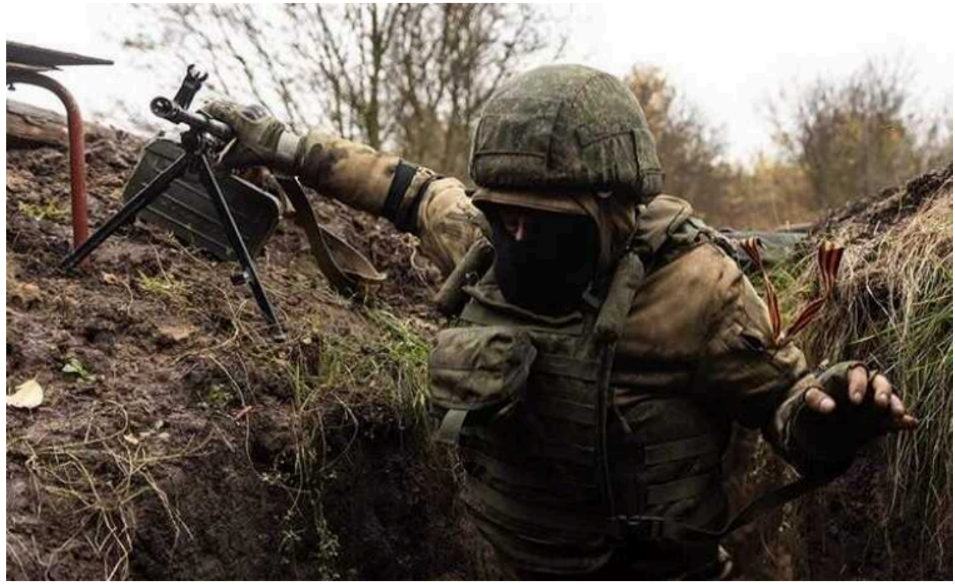
В ISW заявили про вигідну Україні тенденцію у військах РФ: військових профі відправляють на забій

Частина російських польових командирів продовжує всіляко допомагати Україні у війні: вони ухвалюють рішення, які знижують загальну ефективність російських сил. Зокрема, замість того, щоб навчати російських військових працювати з технікою та впроваджувати технології й інновації у бойових операціях, ці командири відправляють підготовлених "фахівців" у піхотні штурми.