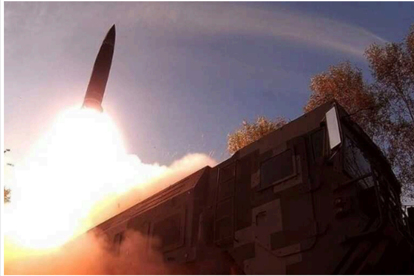
Для ATACMS і Storm Shadow є сотні цілей у Росії: The Times показало мапу

Видання The Times представило мапу об'єктів на території Росії, які можуть бути уражені британськими ракетами Storm Shadow.