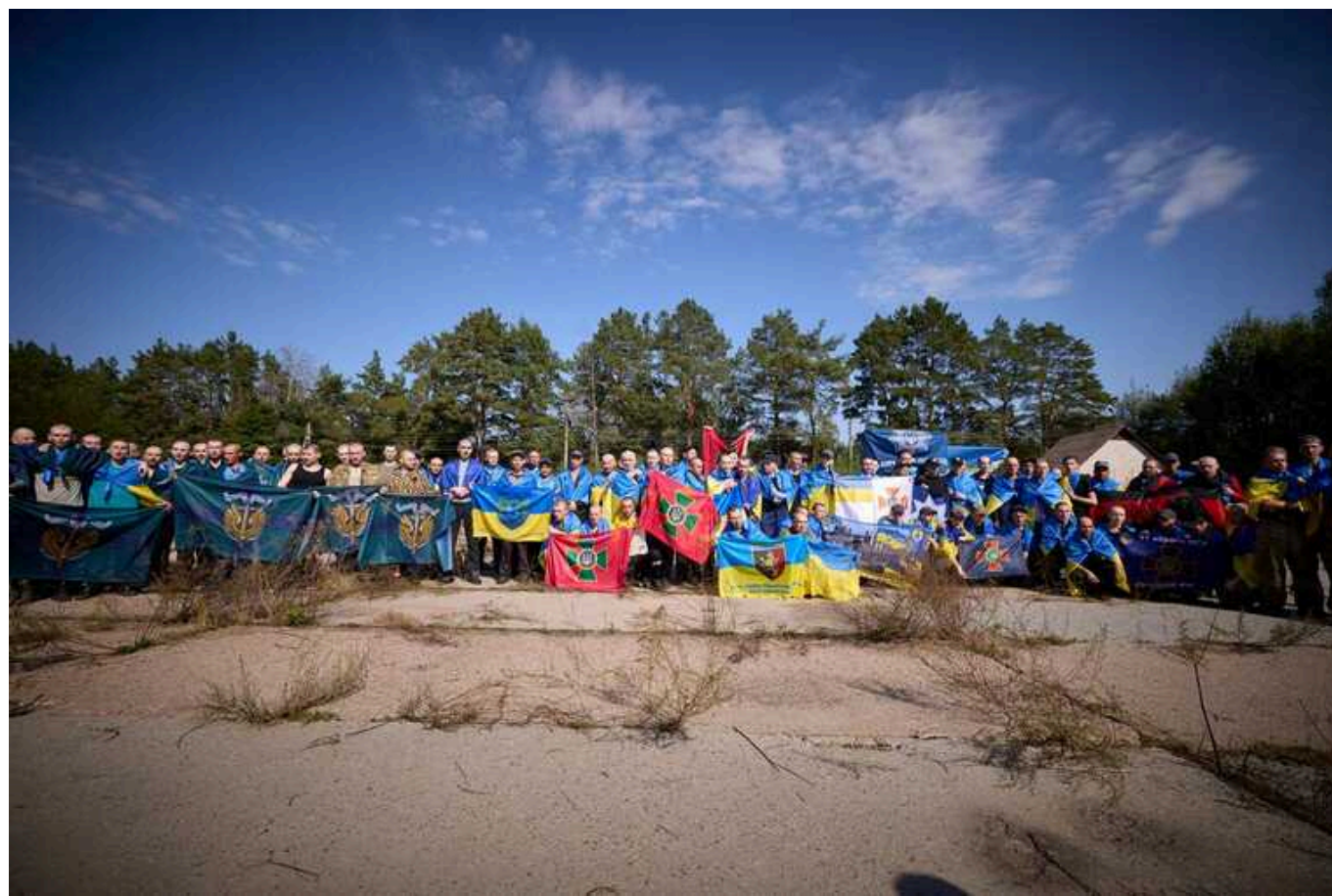
Україна повернула з російського полону ще 103 захисників

Україна повернула з російського полону 103 військовослужбовців ЗСУ, Національної гвардії України, прикордонників та поліцейських, заявив президент Зеленський.