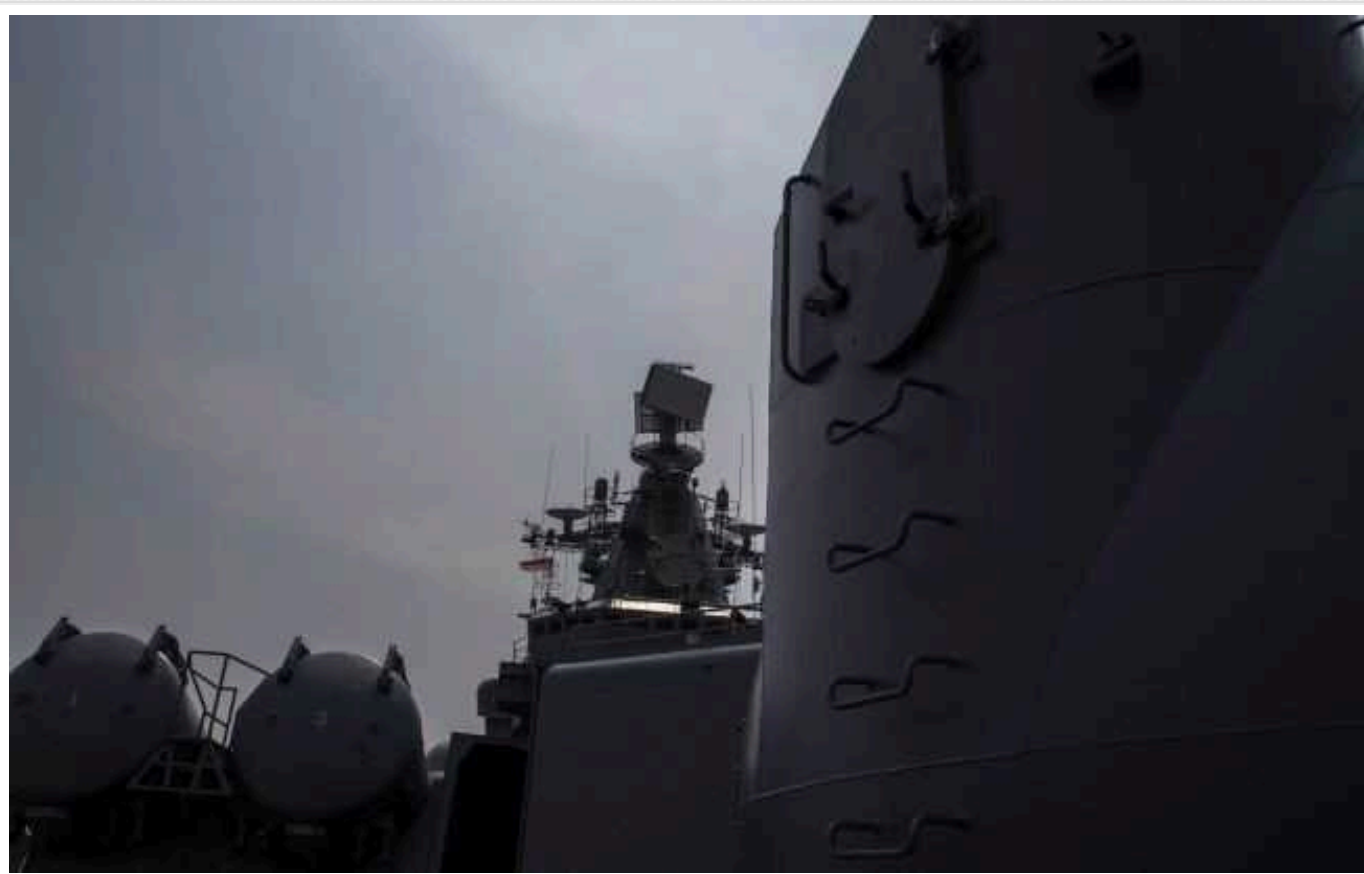
Окупанти вивели 16 кораблів у Чорне море

Станом на ранок 14 вересня в Чорному морі перебувають 16 ворожих кораблів, 7 з яких є носіями крилатих ракет "Калібр" із загальним залпом до 48 ракет.