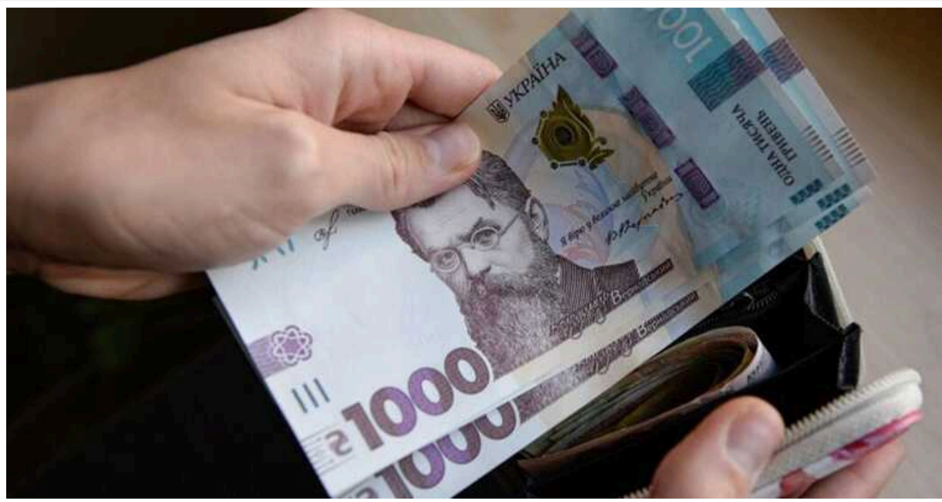
Уряд затвердив проєкт державного бюджету на 2025 рік

У 2025 році доходи очікуються на рівні 2 трлн, а видатки бюджету плануються на рівні 3,6 трлн.