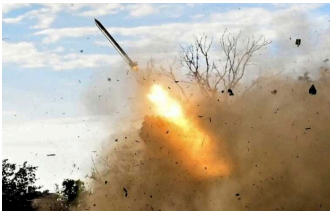
Ситуація на фронті: за добу сталося 138 зіткнень

На фронті минулої доби, 13 вересня, було зафіксовано 138 бойових зіткнень Сил оборони України з російськими загарбниками, і найактивніше ворог наступав на Курахівському напрямку.