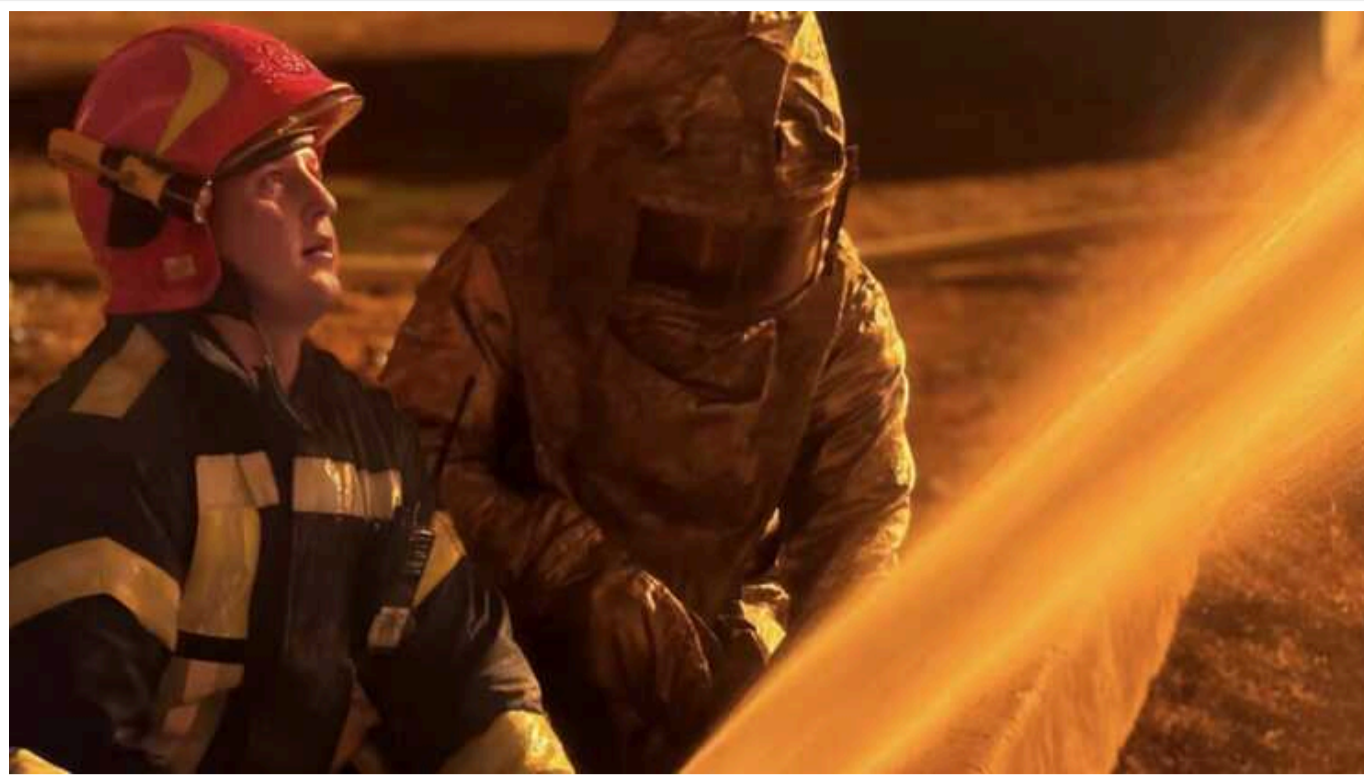
Окупанти вранці завдали авіаудару по Харкову: є влучання

Російські агресори завдали авіаудару по Харкову цієї ночі, 14 вересня. Ворог вдарив по місту керованою авіабомбою (КАБ).