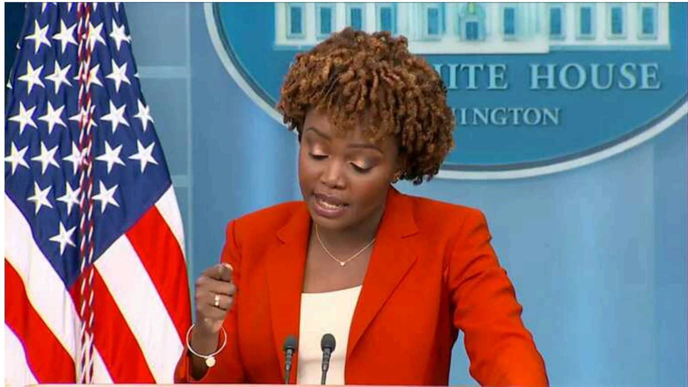
Білий дім відповів на погрози Путіна стосовно далекобійних ударів

У Білому домі підкреслили, що погрози російського президента Володимира Путіна щодо прямої участі НАТО у війні через надання Україні дозволу на далекобійні удари є небезпечною, хоча й не новою, риторикою.