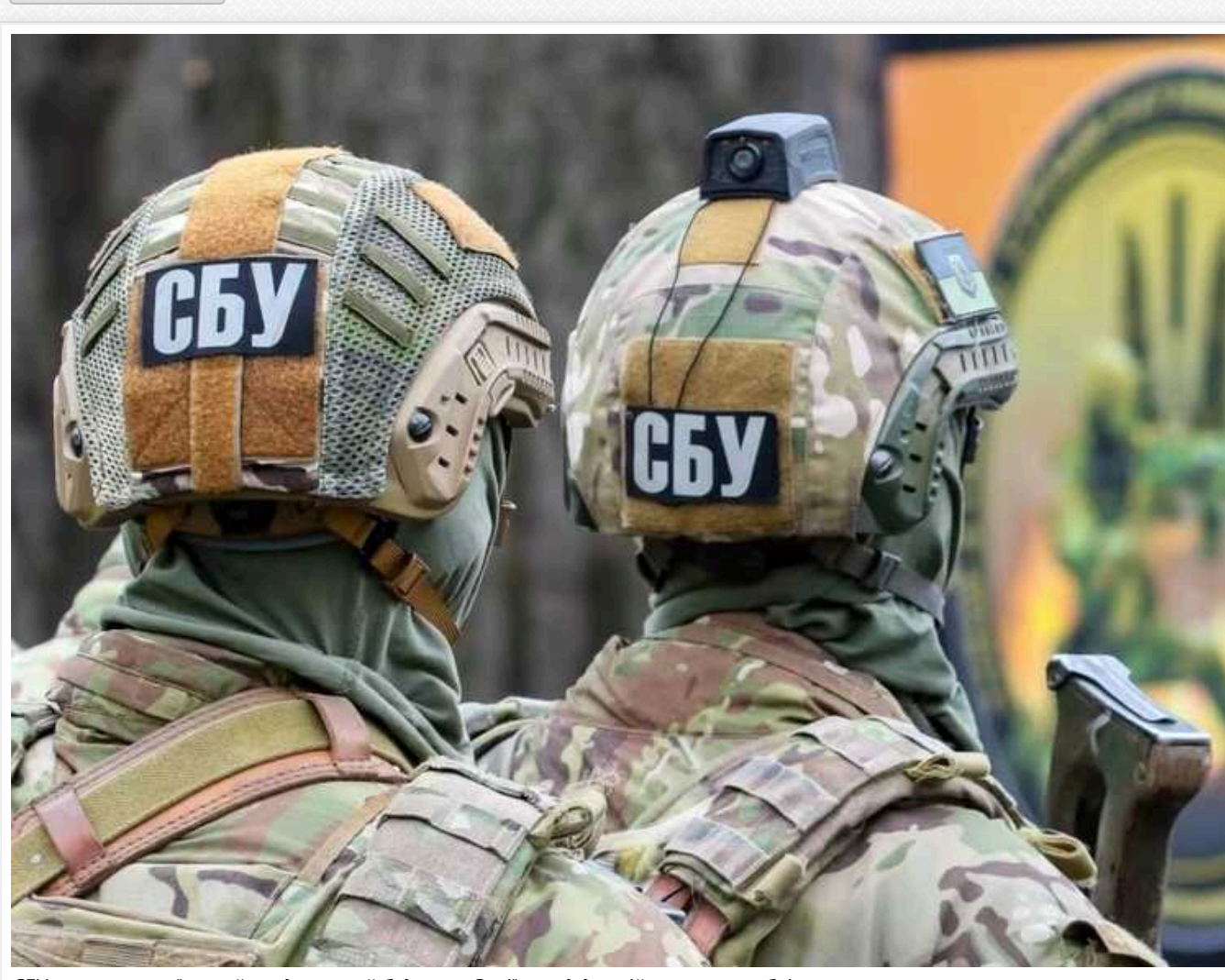
СБУ викрила український холдинг, який будував у Росії завод для військових кораблів

Працівники Служби безпеки України виявили ще одного українського бізнесмена, який співпрацює з Росією. Цей підприємець виїхав з України ще до початку повномасштабної агресії, проте його холдинг займається будівництвом судноремонтного заводу для російських військових кораблів.