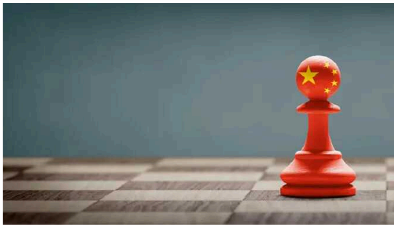
Одного з найбільших аудиторів світу "вигнали" з Китаю

Влада Китаю наклала штраф на аудиторську компанію PricewaterhouseCoopers (PwC), яку звинуватили у порушеннях під час оцінки фінансових звітів будівельної компанії China Evergrande Group. Внаслідок цього діяльність PwC у КНР призупинили на шість місяців.