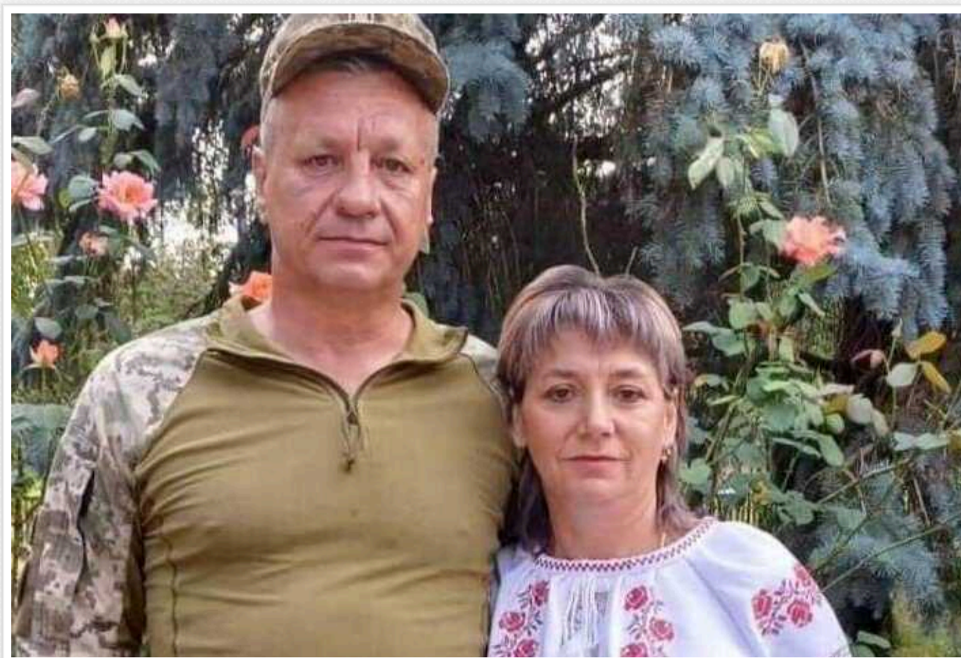
На Полтавщині дружина священника збила на смерть вдову загиблого військового