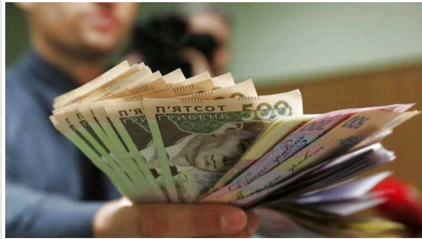
Основні показники проєкту держбюджету-2025: долар по 45, середньомісячна зарплата – 24 тисячі гривень

У 2025 році середньомісячна заробітна плата прогнозується на рівні 24 389 гривень, згідно з проєктом державного бюджету.