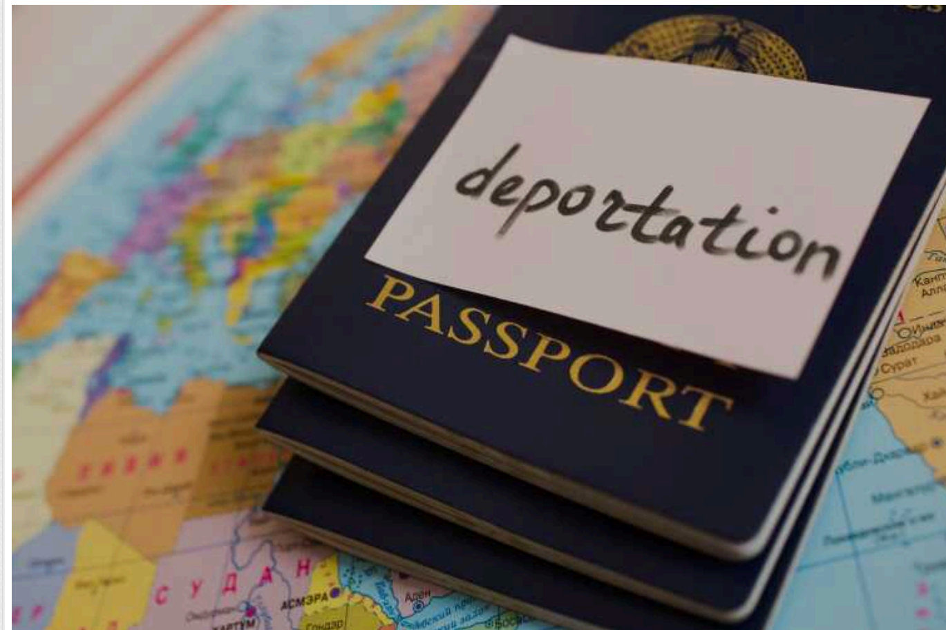
Українця, який забарикадувався у своїй квартирі у Варшаві, вирішили депортувати

19-річний громадянин України, який забарикадувався у своїй квартирі на варшавських Белянах і погрожував перехожим та співробітникам поліції пістолетом, буде депортований.