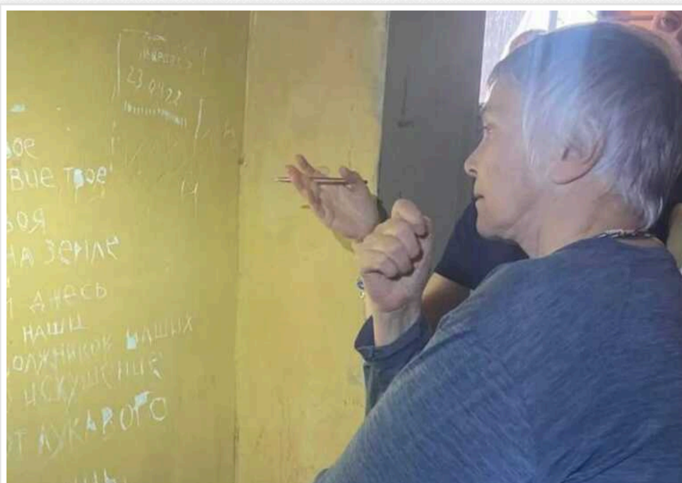
Команда МКС оглянула катівні на Харківщині, де окупанти знущалися з українців

Представники Міжнародного кримінального суду (МКС) відвідали катівні, які російські загарбники організували під час окупації Харківської області. Тут вони утримували і катували місцевих мешканців.