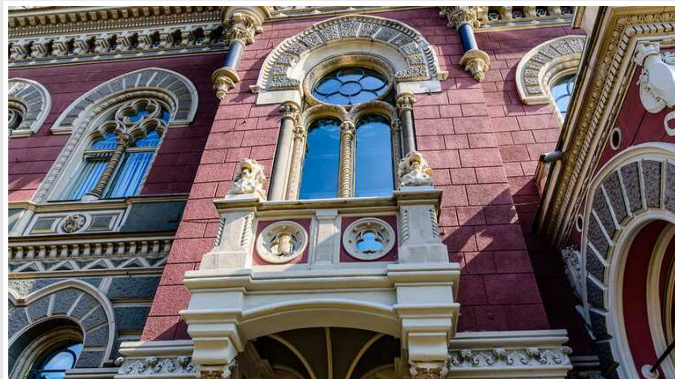
У НБУ хочуть закрити банкам можливість ховати гроші українців від арештів

НБУ прагне усунути у банків можливість приховувати гроші українців від арештів.