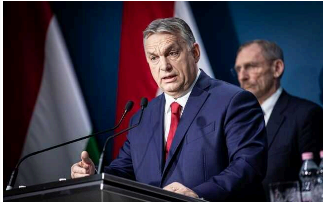
Bloomberg: Після візиту до Москви Орбан обіцяє більше дипломатичних сюрпризів

Прем'єр-міністр Віктор Орбан заявив, що після візиту до Москви в рамках так званої мирної місії на початку головування Угорщини в Європейському Союзі, ймовірно, будуть нові несподівані дипломатичні кроки.