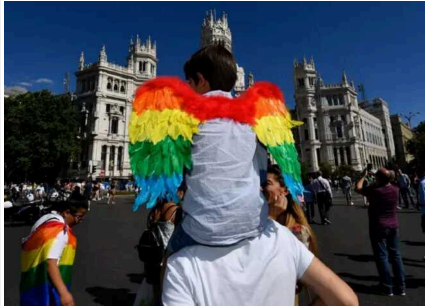
У Великій Британії завищили кількість трансгендерів під час перепису населення

Владі Великої Британії вдалося завищити кількість трансгендерів, зареєстрованих під час перепису населення. До цього списку потрапили мігранти, які не володіють англійською мовою.