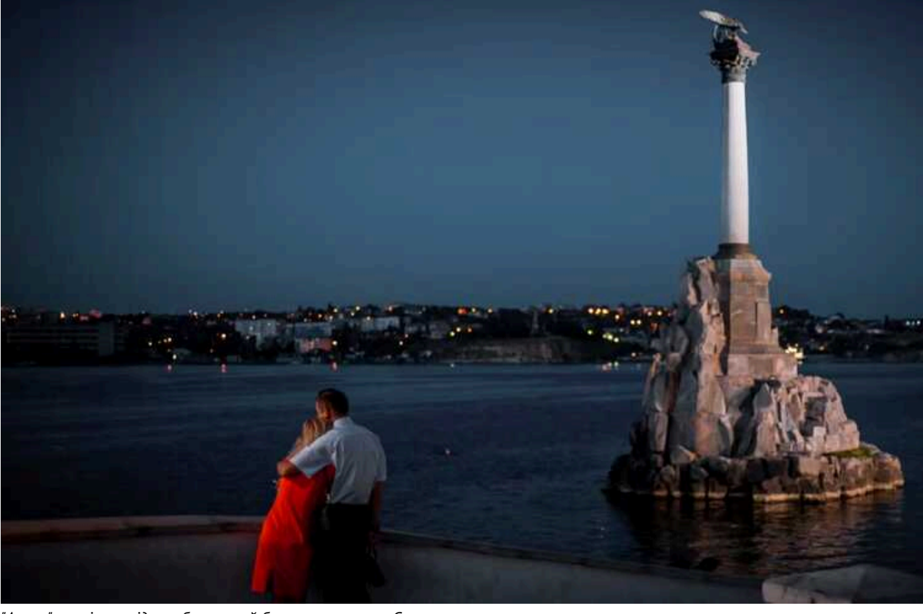
"Атеш" провів розвідку узбережжя й бухт окупованого Севастополя

Агенти воєнного руху українців і кримських татар "Атеш" здійснили розвідувальні заходи на узбережжі та в бухтах окупованого Севастополя. Більшість кораблів Російської Федерації покинули порти, захоплені аеросером в Україні, проте військові катери берегової охорони окупантів активно намагаються виявити можливу появу морських дронів.