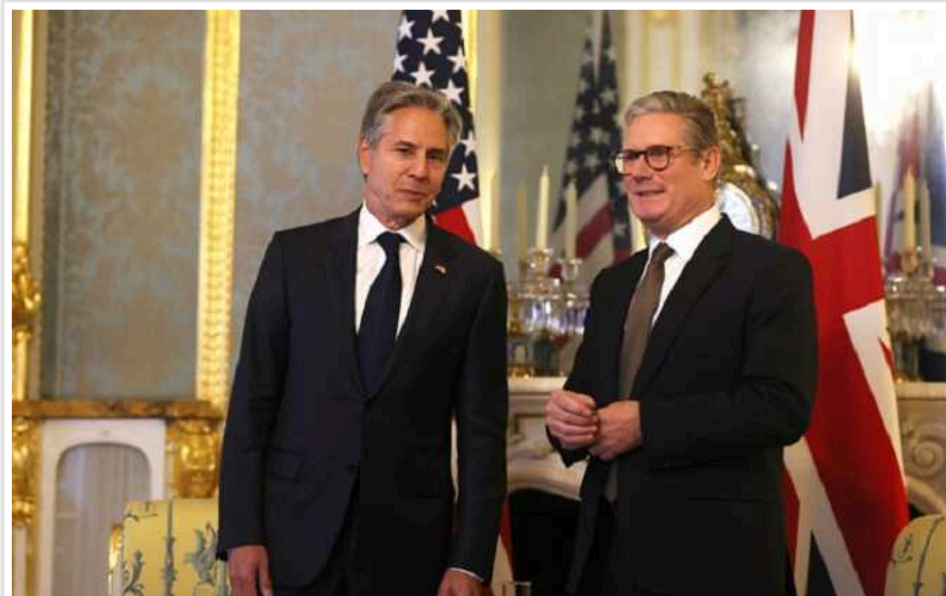
Дозвіл на далекобійні удари по РФ не буде оголошено цими вихідними, - Politico

Угода щодо можливого дозволу Україні застосовувати далекобійну британську та американську зброю проти РФ може бути оголошена пізніше цього місяця - на Генеральній Асамблеї ООН, де будуть присутні, зокрема, лідери США та Британії Джо Байден і Кір Стармер, пише Politico з посиланням на джерела.