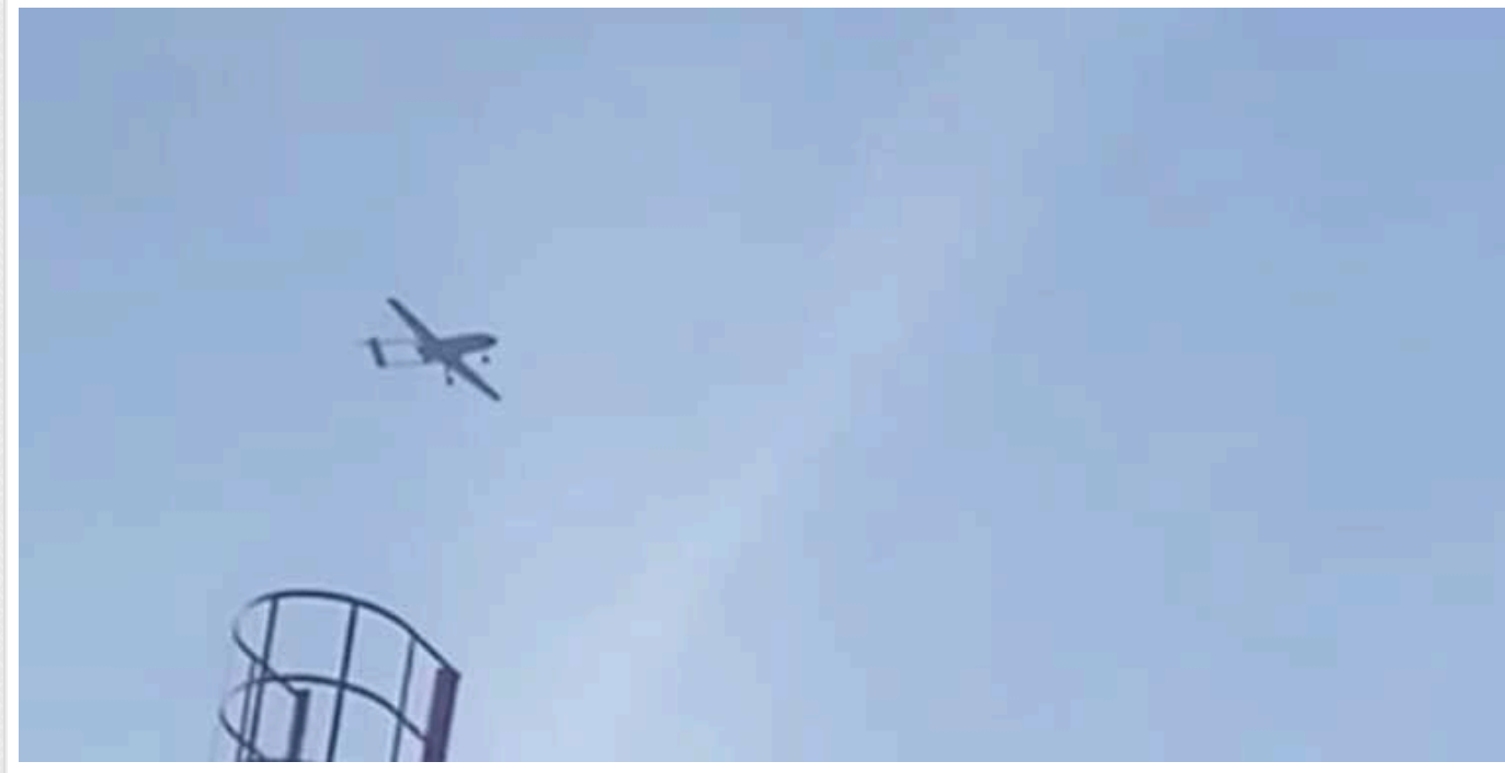
У Росії виробляють ударні дрони з дальністю польоту до 1500 км, - Reuters

У Росії вже протягом року ведеться виробництво ударних дронів із дальністю польоту до 1500 км, які встигли використати для атак на Україну, повідомляє Reuters, зсилаючись на джерела.