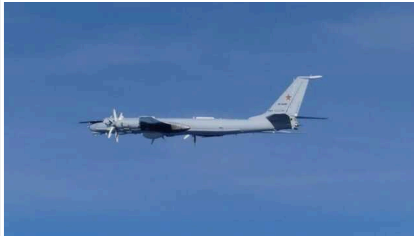
Японія піднімала в повітря винищувачі через російські літаки, що облітали архіпелаг

Японія підняла в небо винищувачі після того, як російські військові літаки вперше за п'ять років облетіли архіпелаг.