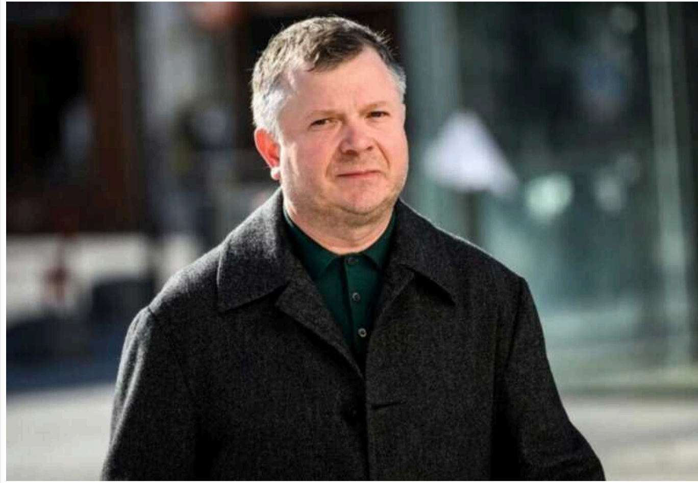
Апеляційна палата залишила під заочним арештом олігарха Жеваго

Апеляційна палата Вищого антикорупційного суду залишила під заочним арештом олігарха Костянтина Жеваго у справі про надання неправомірної вигоди колишньому голові, судді Верховного суду Всеволоду Князеву.