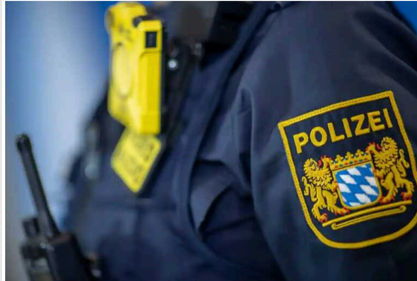
У Баварії затримали ісламіста, який планував вбити якомога більше військовослужбовців

У баварському місті Гоф правоохоронці затримали 27-річного сирійця, який нібито планував напад на солдатів. Повідомляється, що він придбав два мачете.