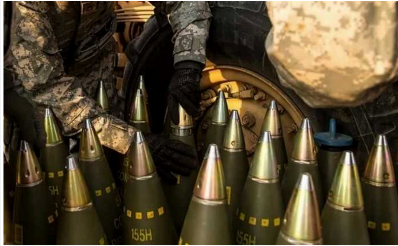
Польща, попри обіцянки, не фінансує «чеську ініціативу» з купівлі снарядів для України

Польща нібито є єдиною з усіх країн, які пообіцяли підтримати ініціативу Чехії з придбання артилерійських снарядів для України по всьому світу, що досі не надала на це ніяких коштів, тоді як Німеччина інвестувала найбільше.