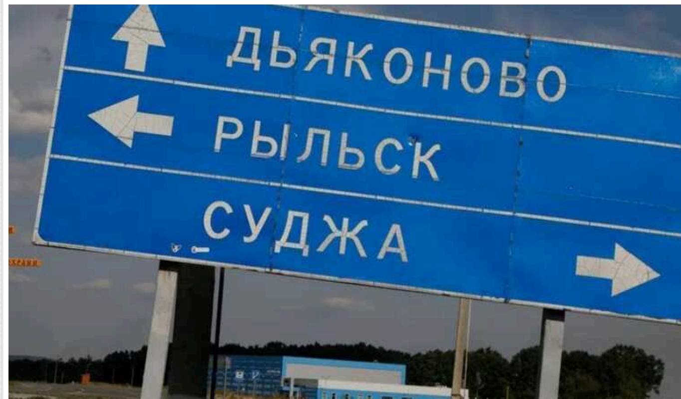
У Пентагоні прокоментували російські контракти на Курщині

Росія дійсно розпочала контрнаступальні дії на території Курської області. Однак наразі це "незначна спроба".