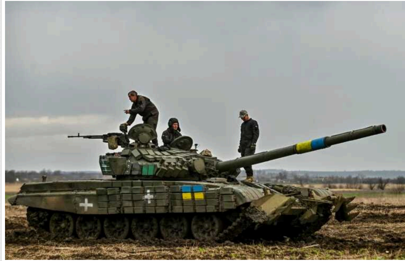
WSJ: Україна і Росія стали економніше використовувати танки, тому що їх можуть уразити дешеві дрони

Про це повідомляє The Wall Street Journal .