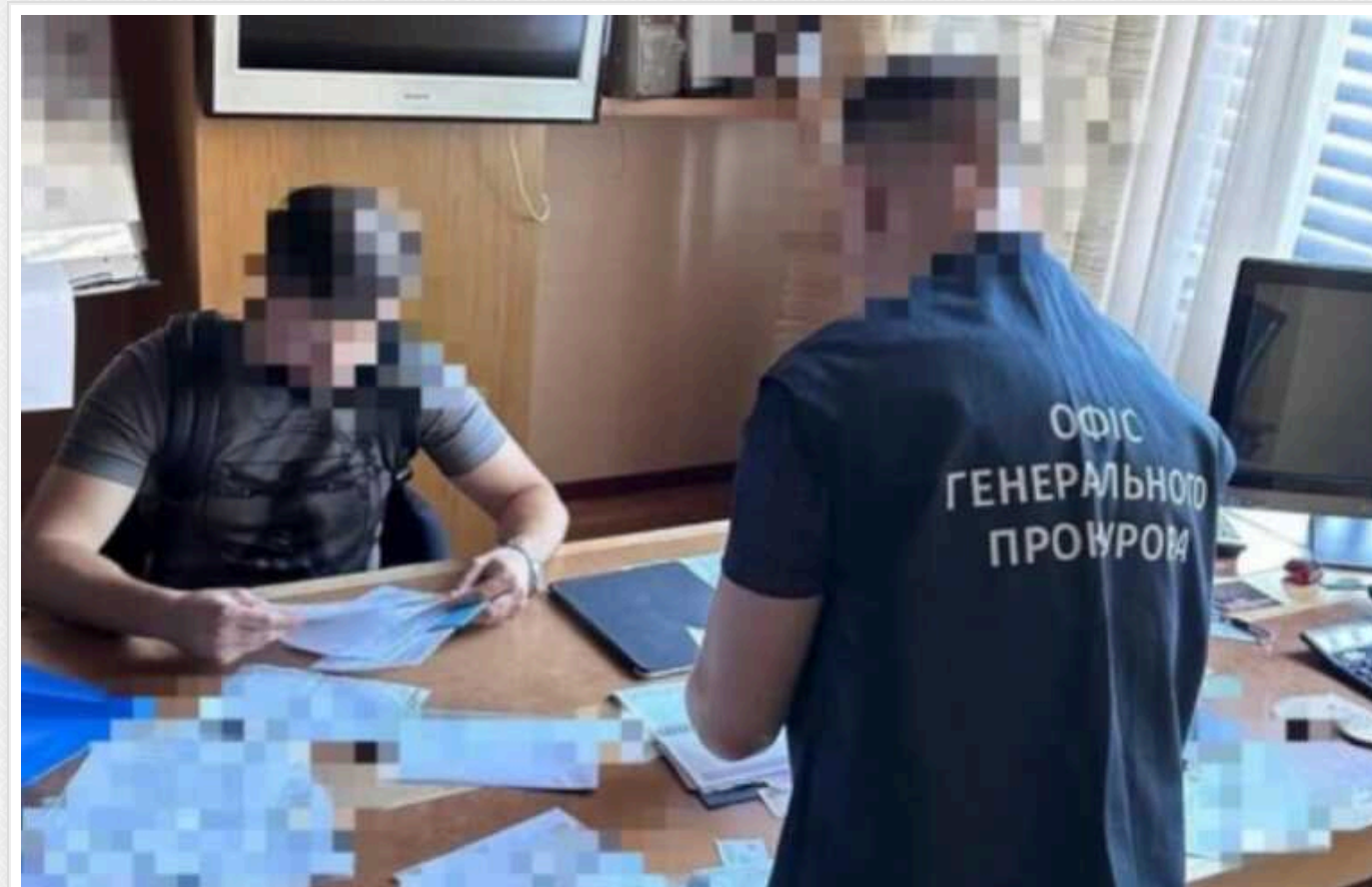
ДБР оголосило підозру ексдепутату від «Партії регіонів»

Співробітники Державного бюро розслідувань оголосили про підозру народному депутату кількох скликань в ухиленні від сплати податків на суму понад 71,4 млн грн.