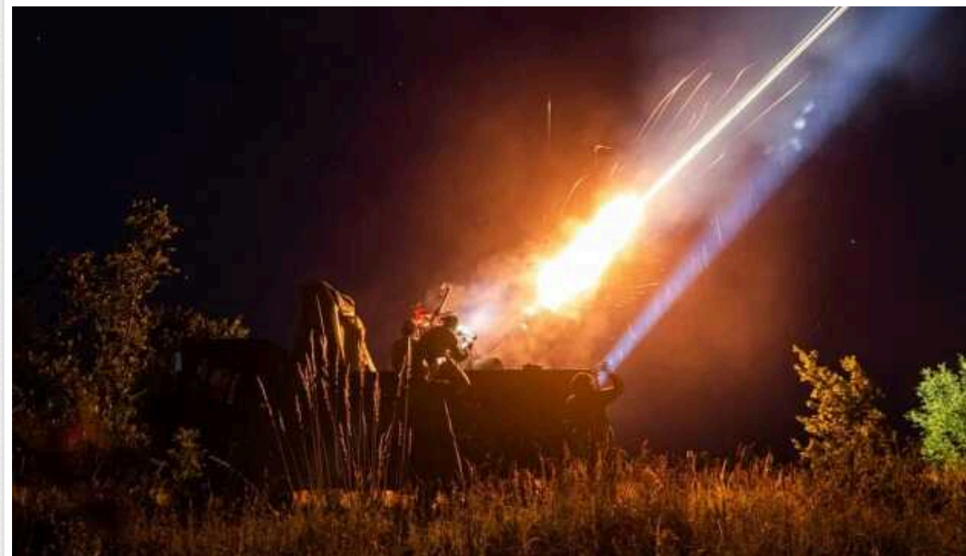
Сили ППО вночі знищили 24 з 26 ворожих «шахедів»

Сили оборони України знищили 24 ворожі ударні БПЛА типу Shahed в межах Миколаївської, Одеської, Херсонської, Хмельницької та Івано-Франківської областей у ніч проти 13 вересня.