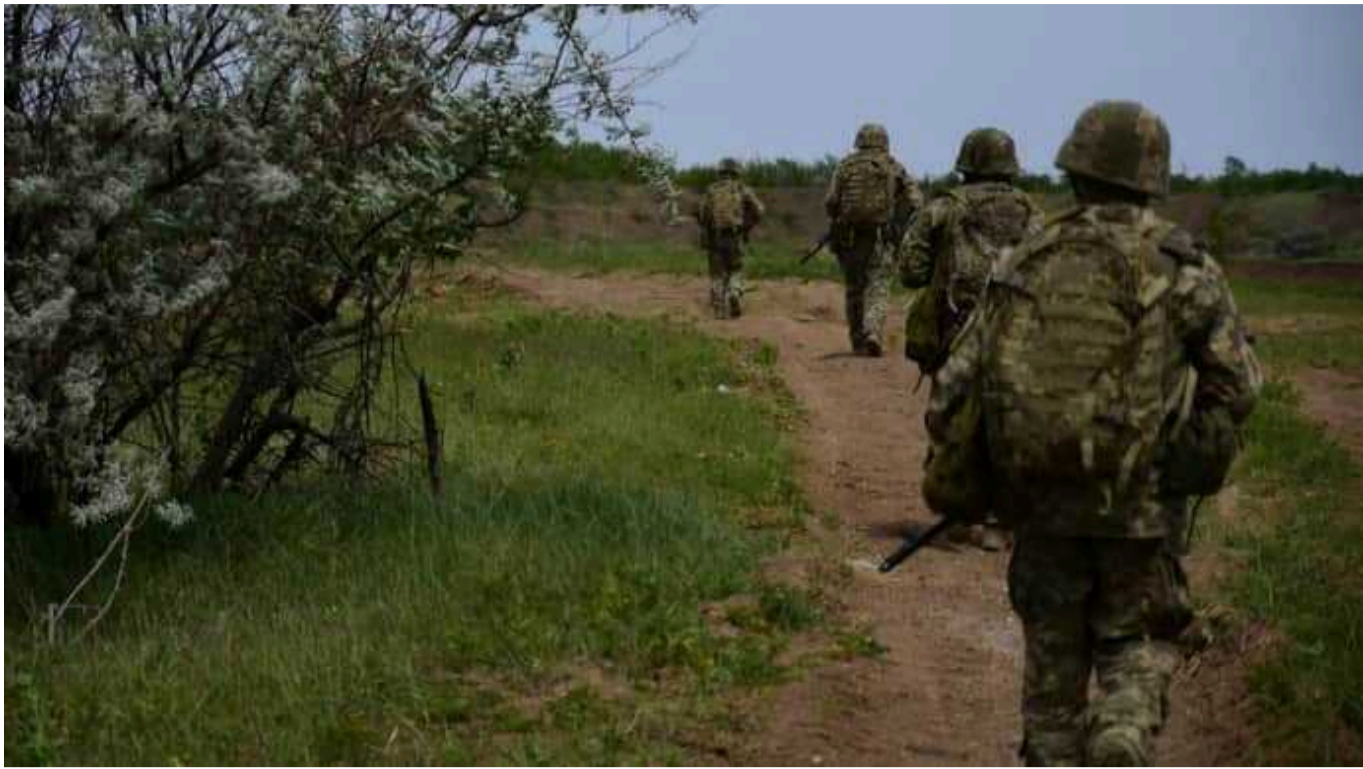
Ситуація на фронті: Минулої доби були зафіксовані 143 бойові зіткнення

У повідомленні Генерального штабу Збройних сил України йдеться про ситуацію станом на 8:00 п'ятниці, 13 вересня, у фейсбуці .