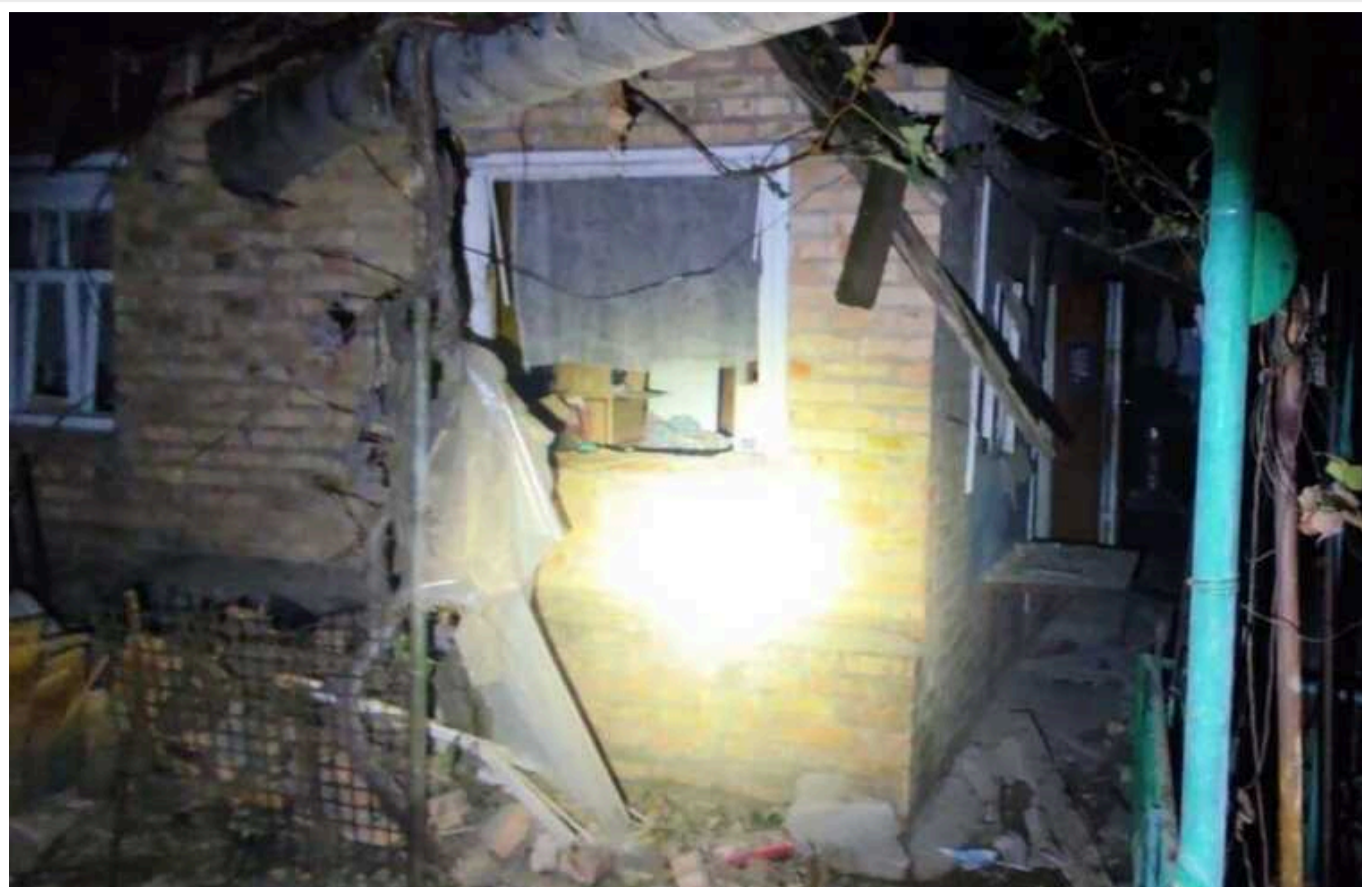
Росіяни вдарили по Дніпропетровщині: пошкоджено будинки, постраждала жінка

Увечері 12 вересня та протягом ночі російські окупанти продовжували тероризувати мешканців Дніпропетровської області. Вороже угруповання завдало ударів по Нікопольському району.