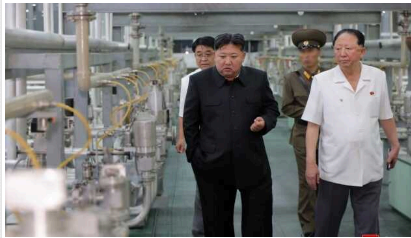
КНДР вперше показала завод з виробництва збройового урану

Північнокорейське державне інформагентство KCNA вперше оприлюднило зображення виробничих майданчиків і центрифуг, де виготовляється збагачений уран для створення ядерних бомб у Пхеньяні.