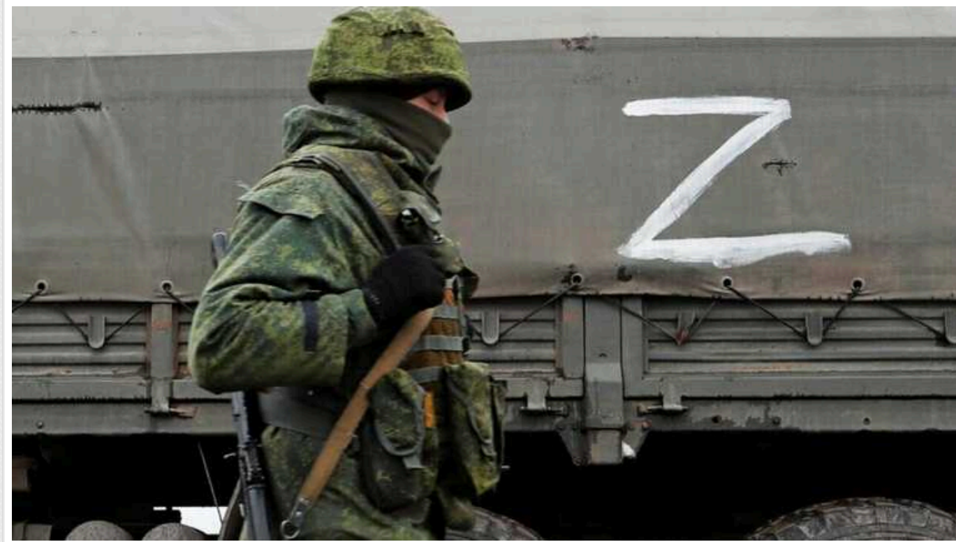
Втрати ворога: ЗСУ знищили ще 1220 окупантів та 18 танків

Українські військові за добу знищили 1220 окупантів, з початку повномасштабної війни – 631 тисячу 420 осіб.