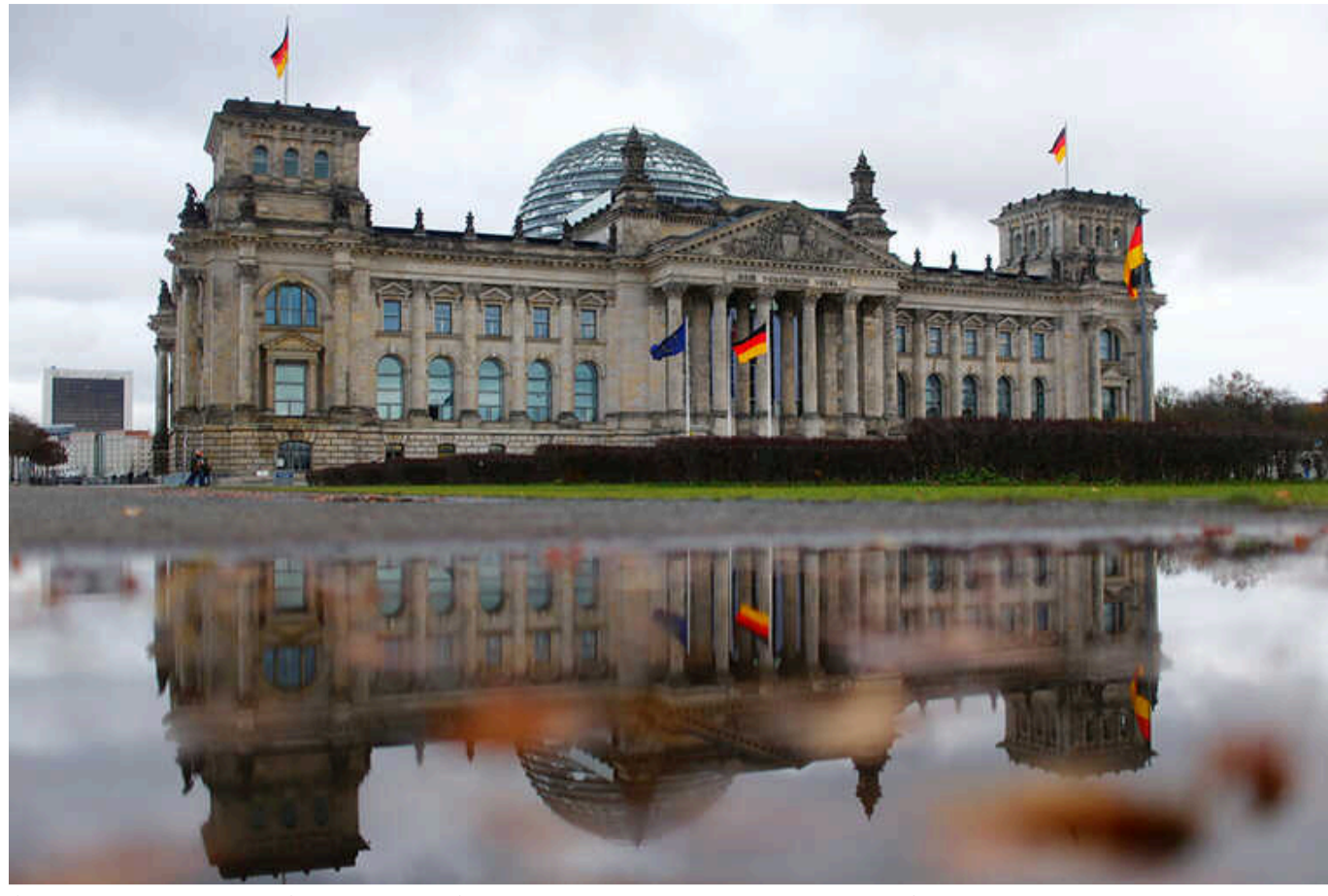
Активісти закликають Бундестаг визнати депортацію кримських татар актом геноциду

Активісти збирають підписи під петицією до Бундестагу для визнання геноцидом депортації кримських татар 1944 року.