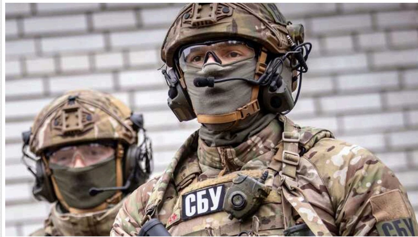
СБУ висунула підозру російській сенаторці від «ДНР»