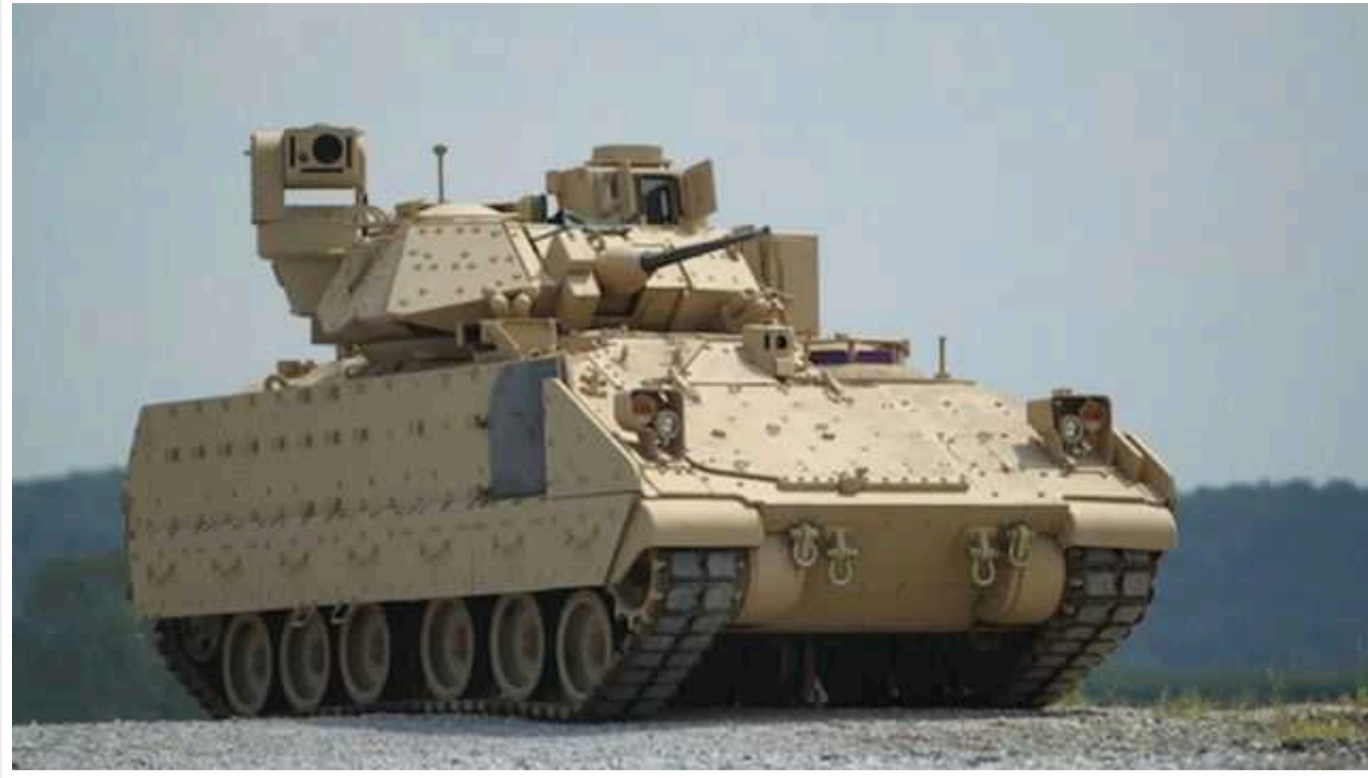
Компанія BAE Systems отримала від Пентагону замовлення на більш ніж 200 бойових машин Bradley