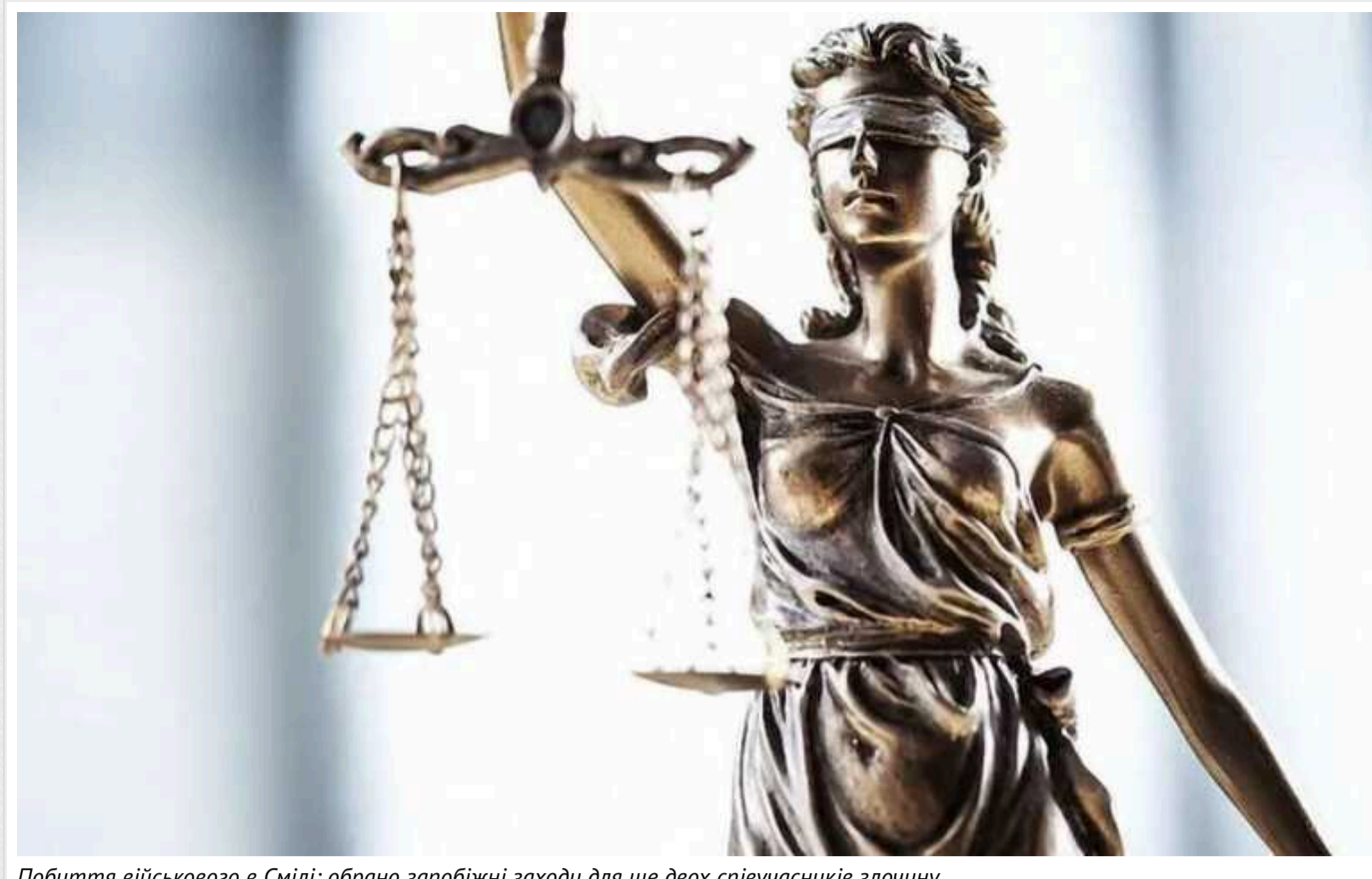
Побиття військового в Смілі: обрано запобіжні заходи для ще двох співучасників злочину

Суд обрав запобіжні заходи ще двом співучасникам нападу на військового у Смілі, що на Черкащині. Вони залишатимуться під цілодобовим домашнім арештом.