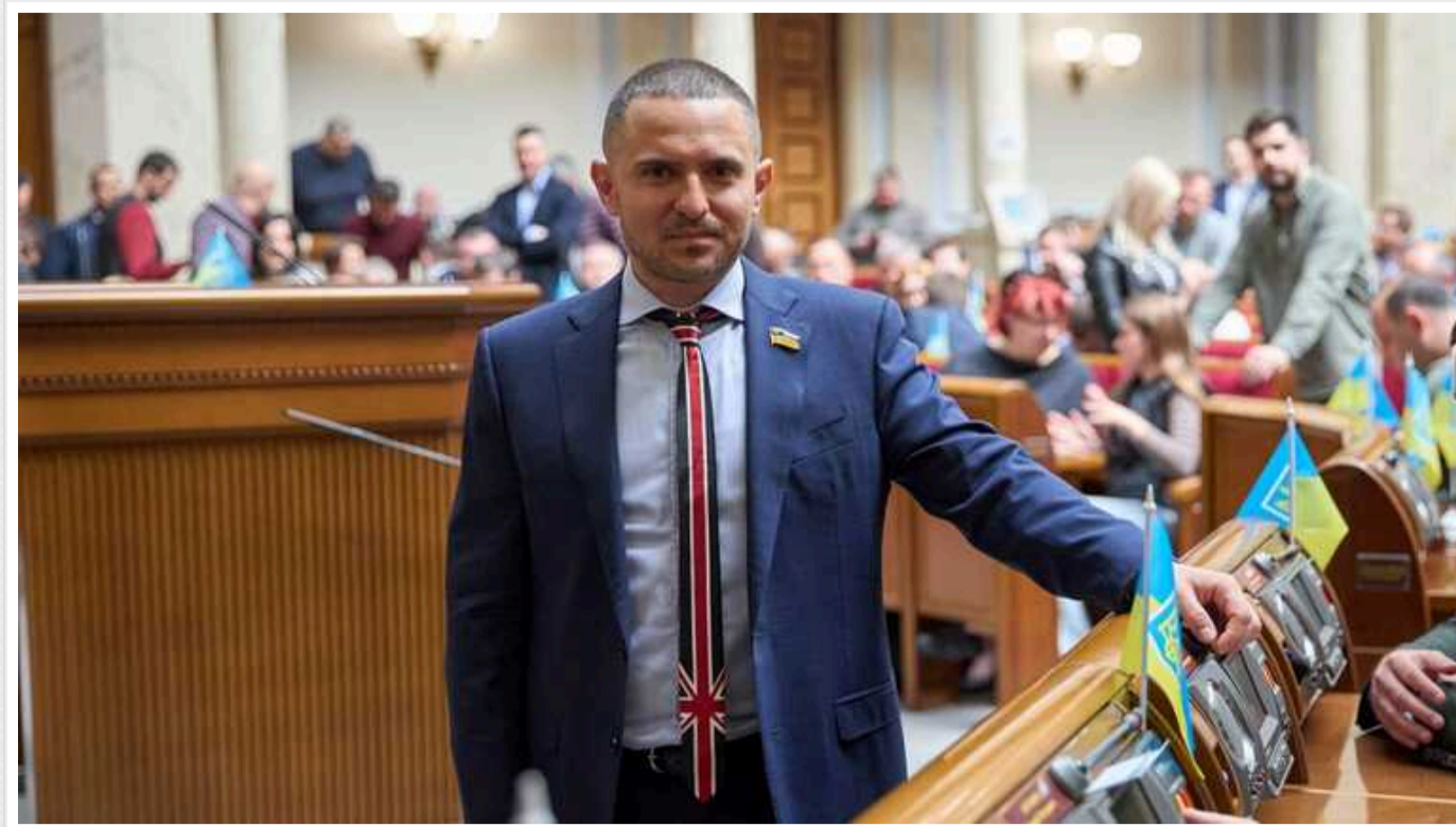
Стали відомі деталі конфлікту за участю депутата Куницького в Києві

Нардеп, який завдав удару людині в центрі Києва, – Олександр Куницький.