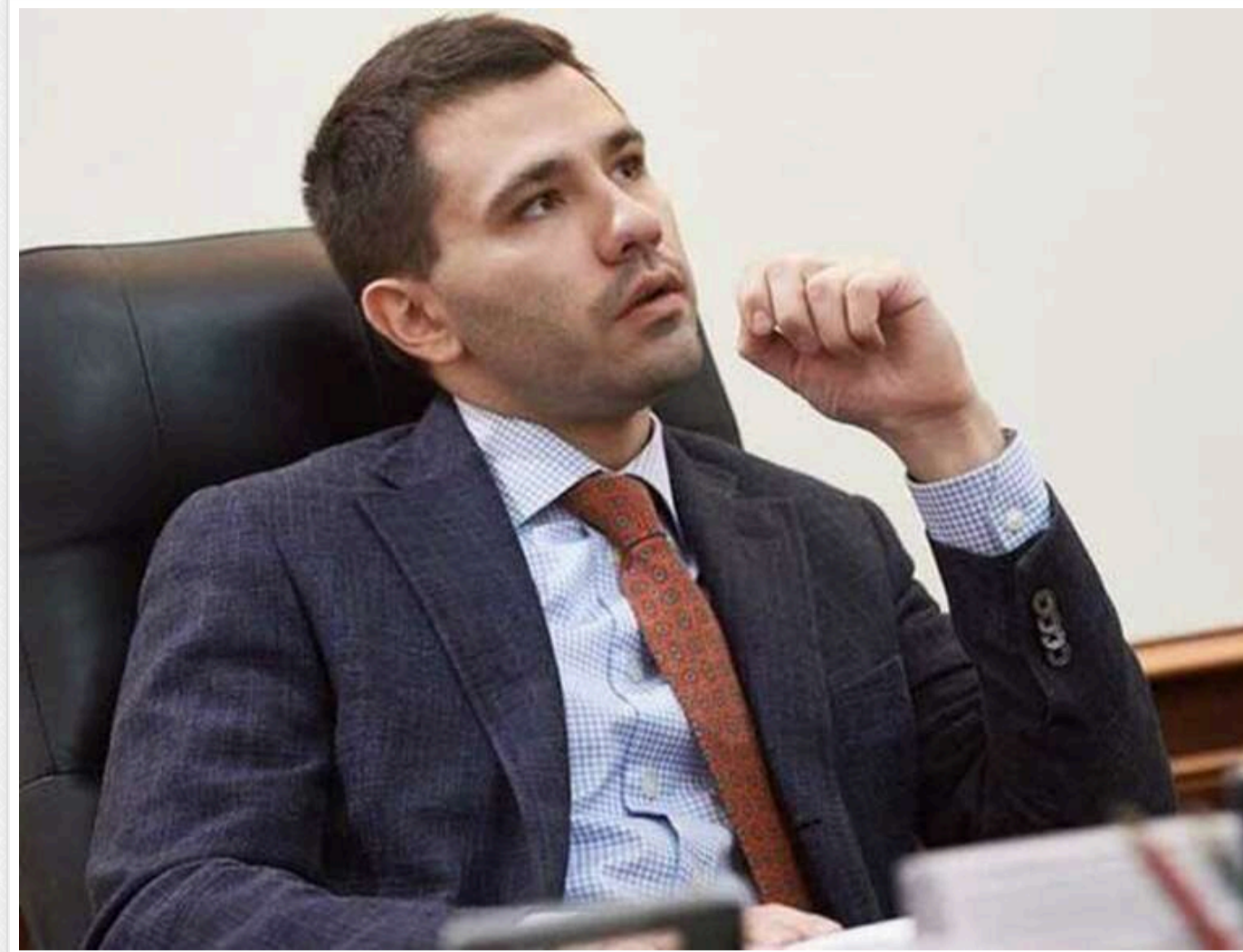
ВАКС відмовив захисту Барбула та Сінгаєвського у відводі судді у справі «Спецтехноекспорту»

Читати на руском Read in English Додати як бажане джерело в Google