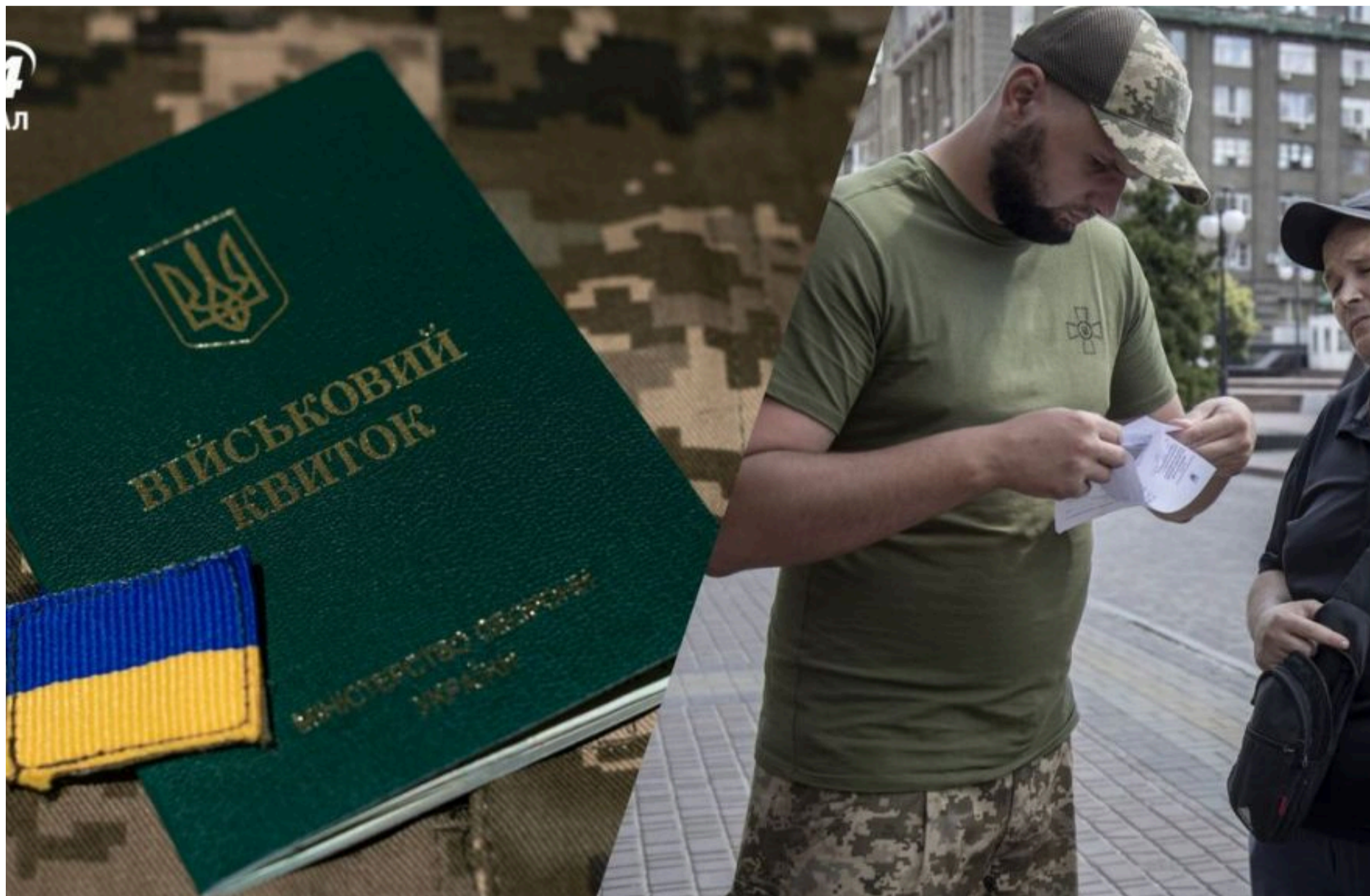
ТЦК/ Фото з відкритих джерел

КАРПЕЦЬ ОЛЕКСАНДР — 27 Травня 2026, 15:18 ⌚ 1 Min Read — АРМІЯ І ЗБРОЯ