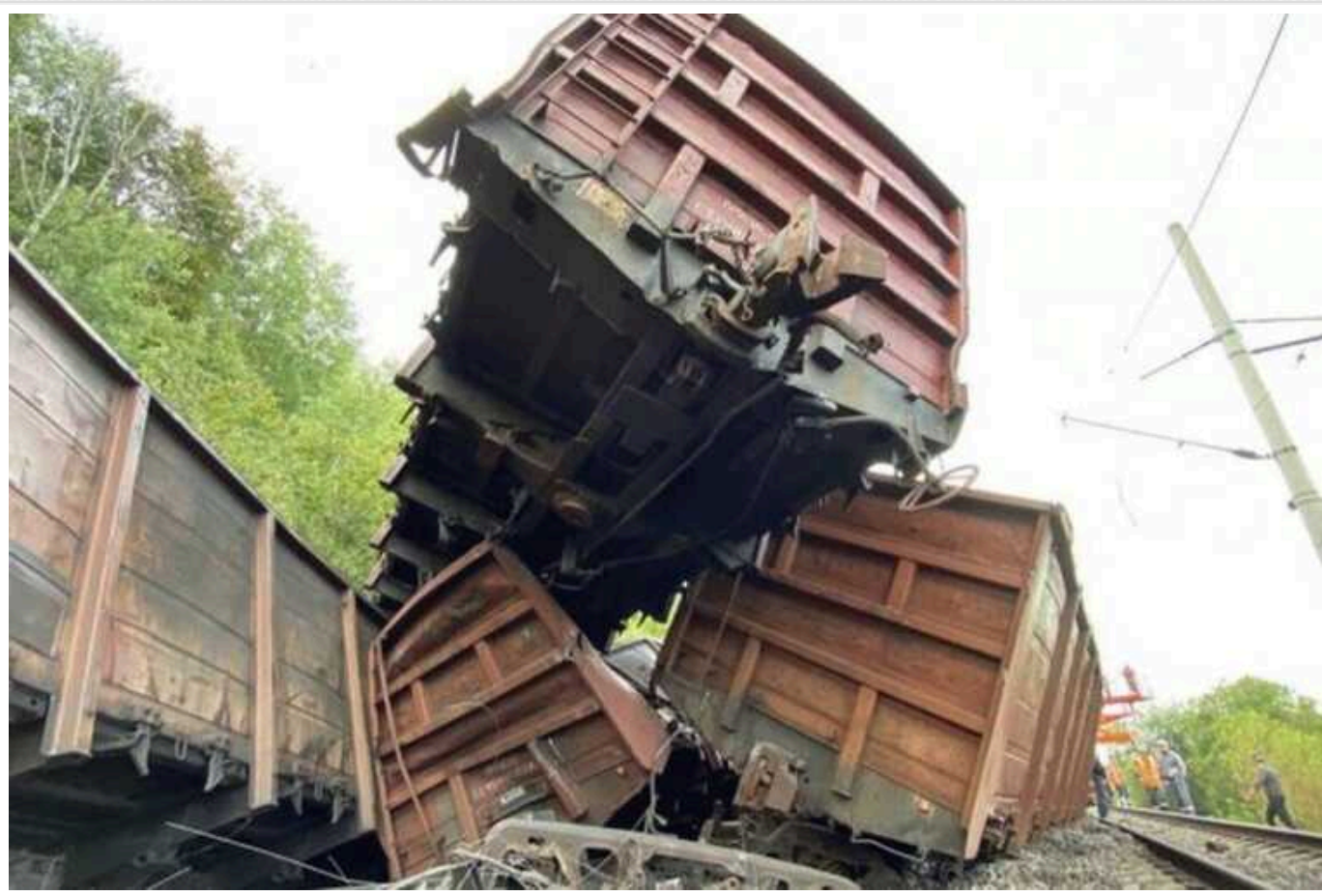
Бійці ГУР і ССО підірвали залізницю в Белгородській області РФ

У Белгородській області Росії українські розвідники та бійці ССО провели спецоперацію на залізниці. Внаслідок підриву з рейок зійшов вантажний потяг, зруйновано полотно.