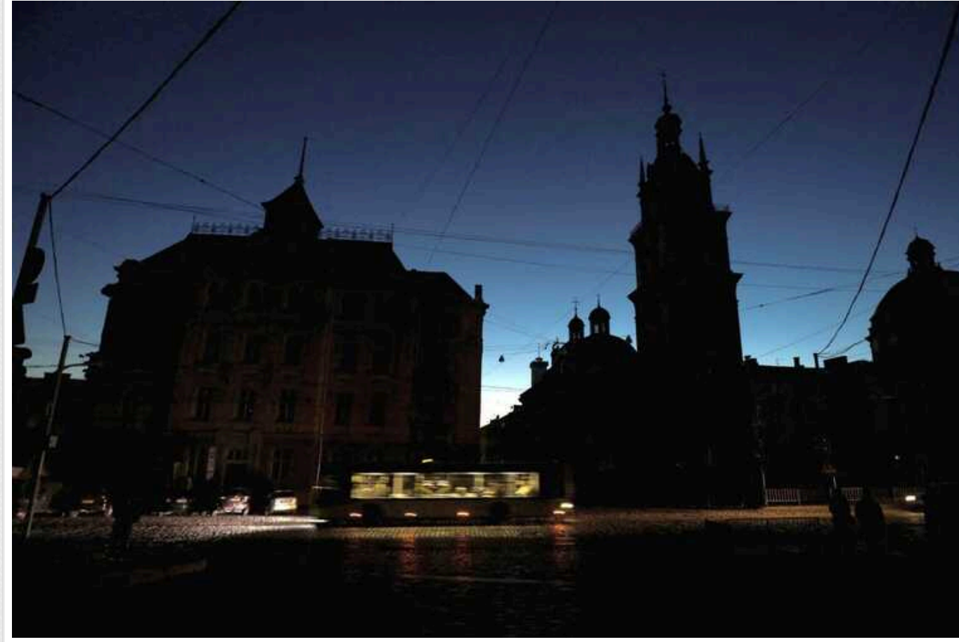
«Укренерго» знову запроваджує графіки відключення електроенергії

Сьогодні, 12 вересня, в Києві та кількох областях України будуть діяти графіки відключення електроенергії – з 13 до 24 години.