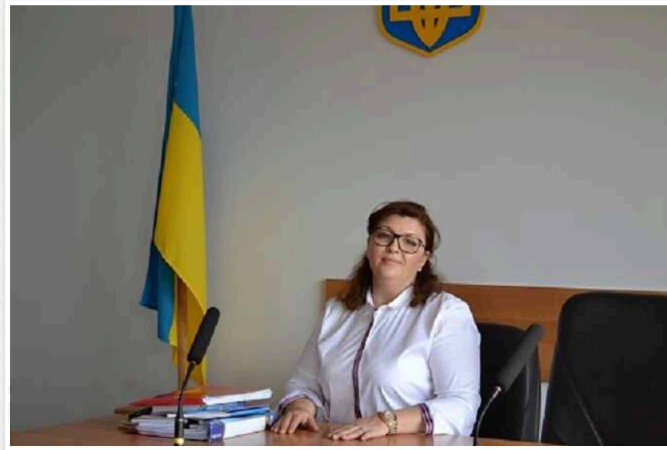
НАЗК перевірить інформацію про можливе недостовірне декларування судді з Одеси Олени Комлевої

Національне агентство з питань запобігання корупції (НАЗК) отримало інформацію про можливе недостовірне декларування з боку судді Одеського апеляційного суду Олени Комлевої та розпочне перевірку.