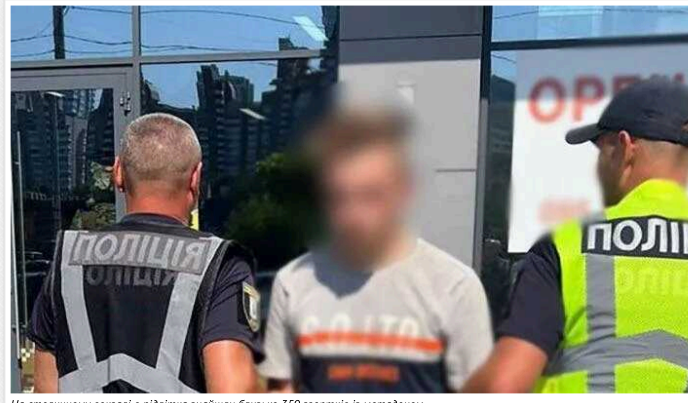
На столичному вокзалі в підлітка знайшли близько 350 згортків із метадоном

У Києві співробітники правоохоронних органів затримали 17-річного юнака, в якого під час перевірки було виявлено близько 350 згортків із метадоном, призначених для закладок. Інцидент стався на Центральному залізничному вокзалі.