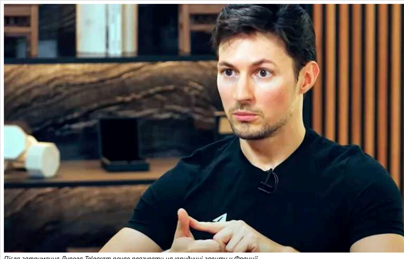
Після затримання Дурова Telegram почав реагувати на юридичні запити у Франції

Telegram почав реагувати на юридичні запити у Франції після затримання Павла Дурова, пише місцеве видання Liberation, посилаючись на правоохоронні органи.