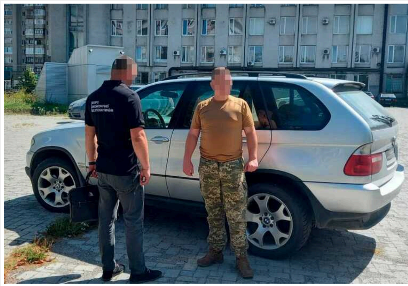
Бюро економічної безпеки на Волині передало ЗСУ три автомобілі, які були ввезені в Україну незаконно

Детективи Територіального управління БЕБ у Волинській області передали на потреби військовослужбовців три автомобілі, які були ввезені в Україну нелегально.