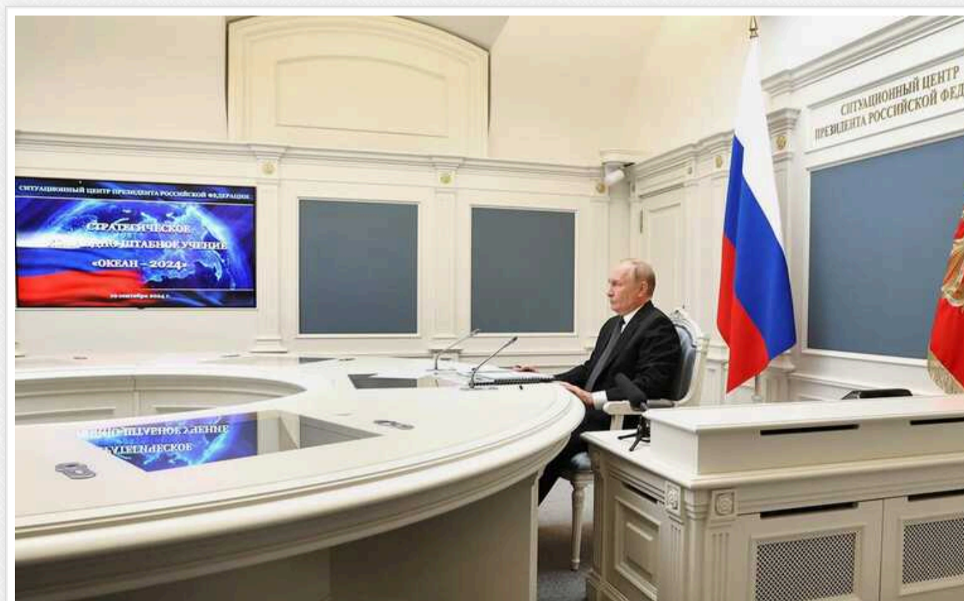
Путін хоче запровадити обмеження на експорт із Росії сировини, стратегічно важливої для Заходу, включно з ураном, титаном і нікелем

Він закликав російських чиновників "поміркувати про це" у відповідь на західні санкції.