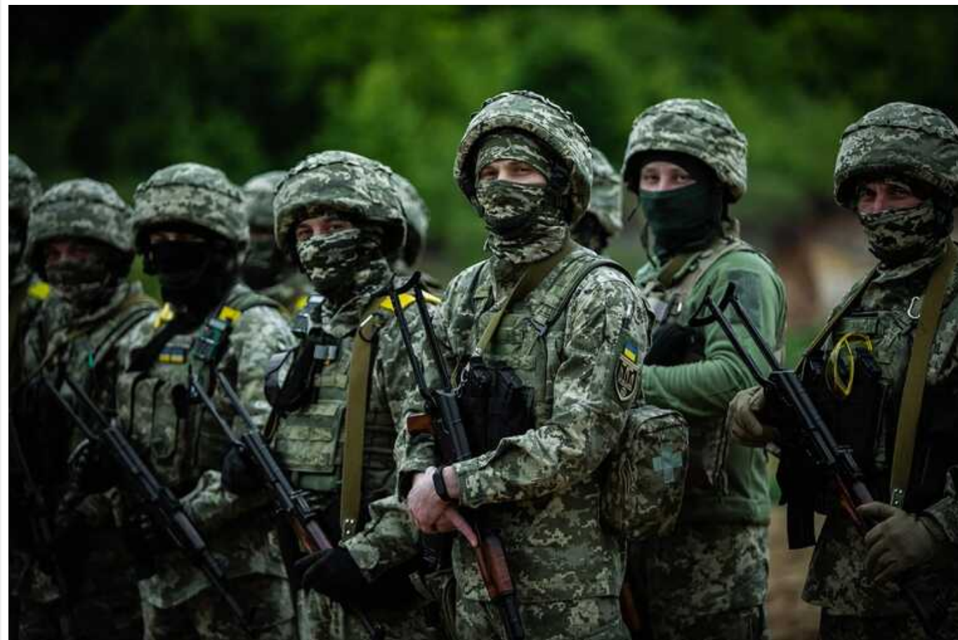
У ЗСУ не вистачає сучасних машин для формування нових бригад, - Forbes

Згідно з інформацією видання, минулої осені українська армія розпочала формування першої з 11 нових бригад. Теоретично ці бригади мали розвернутися на фронті після 6 місяців навчання, але на практиці вони стикаються з гострою нестачею сучасного озброєння.