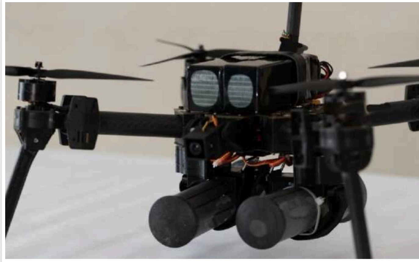
ЗСУ отримають нові дрони-бомбери "Чорна вдова", - Міноборони

Новий дрон "Чорна вдова" був кодифікований та допущений до постачання у війська. Цей безпілотний авіаційний комплекс має кілька переваг.