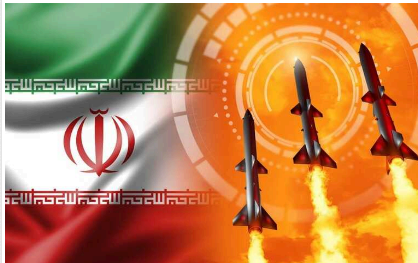
Forbes: РФ може дуже пошкодувати про отримання ракет з Ірану

На початку вересня Росія отримала першу партію з 200 ракет Fath-360 від Ірану для посилення бомбардувань України. Однак, як повідомляє Forbes, ці поставки можуть мати негативні наслідки для самої Росії.